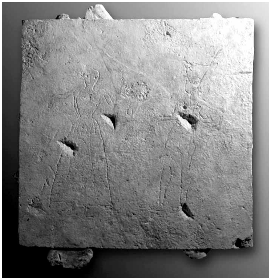
Lámina 4. Final.

tabique para la extracción del grafito (véase Lám. 1). Tras proteger el conjunto con acolchado sobre elemento rígido se trasladó en bloque para su posterior intervención en el laboratorio. Allí, la primera tarea consistió en la retirada del exceso de peso del material constructivo compuesto por mortero y clastos. Diversos elementos lapídeos del aparejo se situaban muy próximos a la superficie, lo cual propició la aparición de fisuras, dificultando el proceso. Estas fueron consolidadas para frenar su deterioro con la aplicación de resina acrílica en diferentes proporciones (Lám. 2). A continuación se dio paso a la regularización del reverso para aportar mayor estabilidad a la pieza, retirada de la protección superficial, seguido de las reintegraciones volumétrica y pictórica de las grietas aparecidas mediante estuco, resina acrílica y pigmentos minerales estables. De cara a una presentación óptima de la pieza, se procedió al recorte y pulido de las aristas laterales dejando vistas algunas inclusiones de desgrasante lítico, por su proximidad a la superficie decorada (Lám. 4). Gracias a la consolidación y limpieza realizadas se han podido apreciar nuevos trazos que confieren mayor detalle al motivo antropomorfo (Fig. 1).