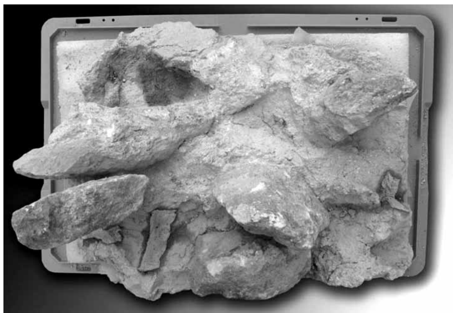
Lámina 2. Extracción peso y consolidación.

más por una perforación de tres milímetros de diámetro a la altura del pecho. También nos dificulta su lectura la presencia de una serie de líneas paralelas verticales incisas sobre el mismo. Se observa una marca más profunda al inicio de cada línea incisa, lo cual indica que se ha realizado con un elemento punzante, cortante y metálico, de arriba a abajo, posiblemente un cuchillo o similar. Así mismo, la superficie se ve afectada por otros desgastes y pequeñas pérdidas volumétricas fruto de la vejez y uso.