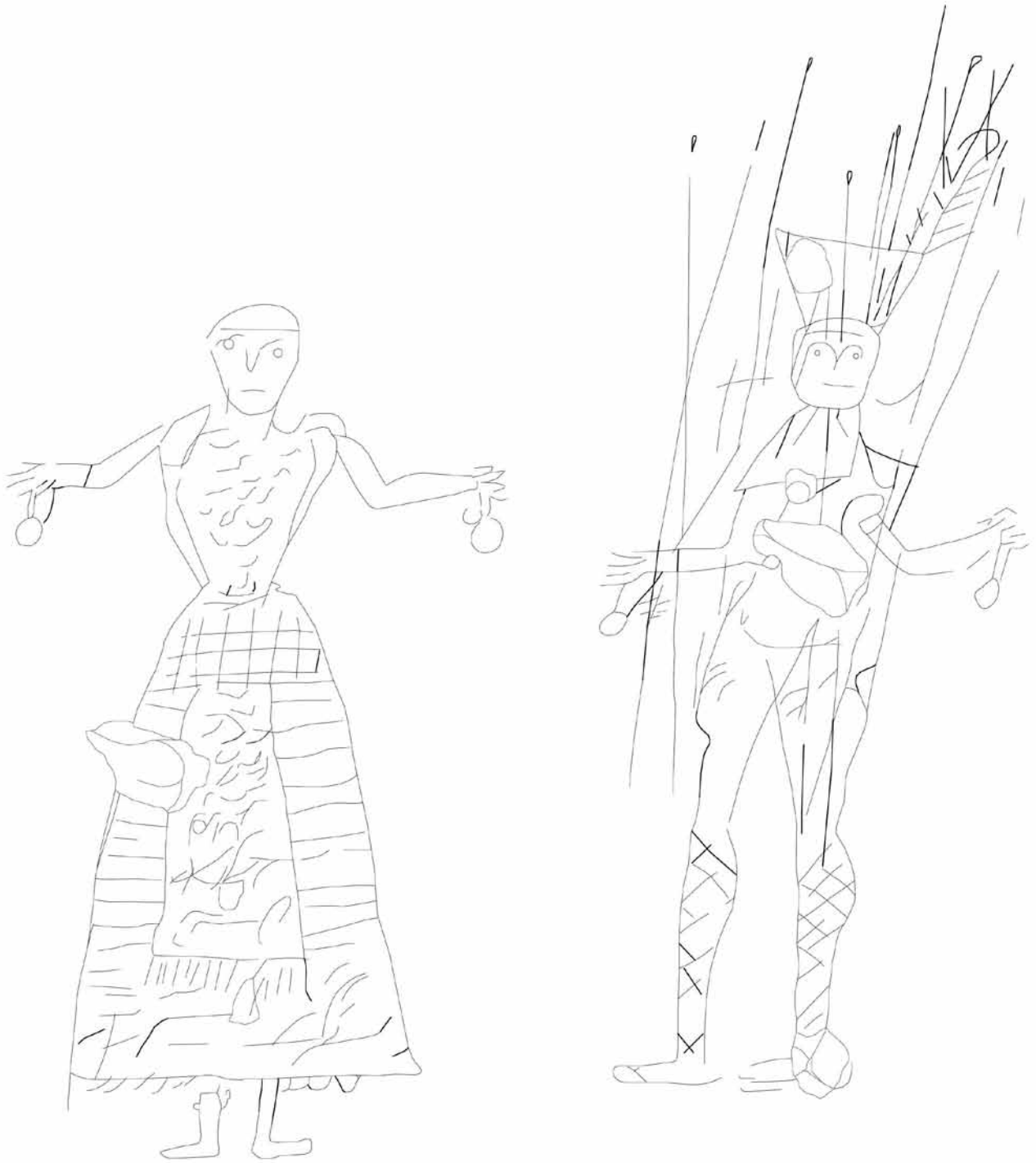
Figura 1. Los antropomorfos.