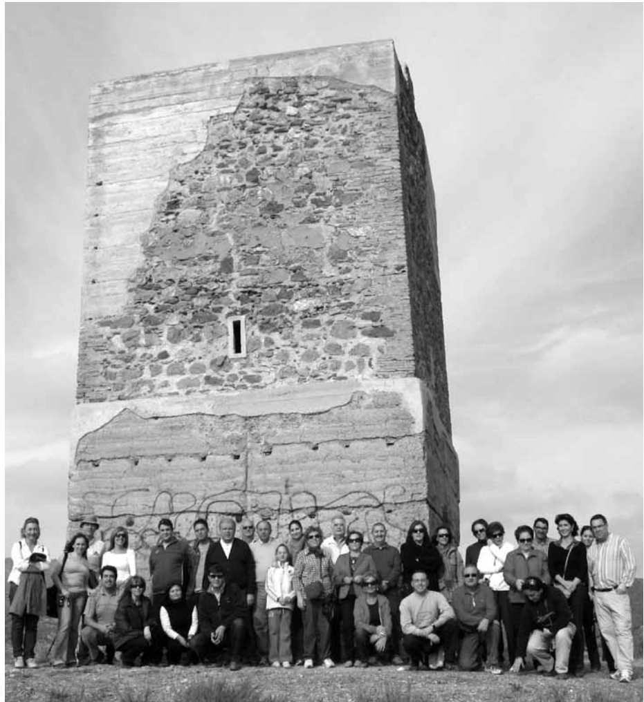
Lámina 14. Visita a la torre de La Torrecilla (Lorca) con motivo de las fiestas patronales de San Clemente.

Además han utilizado el taller de restauración y los laboratorios del MUAL durante un año los dieciocho alumnos y tres monitores del taller Cronos de la Concejalía de Empleo.