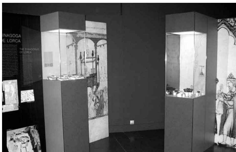
Lámina 1. Exposición temporal “Lorca. Luces de Sefarad”, sede Museo Arqueológico de Murcia.

2.907; Lámpara V de vidrio hallada en la sinagoga del castillo de Lorca: 2.908; Lámpara VI de vidrio hallada en la sinagoga del castillo de Lorca: 2.909; Lámpara VII de vidrio hallada en la sinagoga del castillo de Lorca: 2.910; Lámpara VIII de vidrio hallada en la sinagoga del castillo de Lorca: 2.911; Lámpara IX de vidrio hallada en la sinagoga del castillo de Lorca: 2.912; Lámpara X de vidrio hallada en la sinagoga del castillo de Lorca: 2.926; Lámpara XI de vidrio hallada en la sinagoga del castillo de Lorca: 2.927; Lámpara XII de vidrio hallada en la sinagoga del castillo de Lorca: 2.890; Lámpara XIII de vidrio hallada en la sinagoga del castillo de Lorca: 2.930; Lámpara XIV de vidrio hallada en la sinagoga del castillo de Lorca: 2.946; Lámpara XV de vidrio hallada en la sinagoga del castillo de Lorca: 2.945; Lámpara XVI de vidrio hallada en la sinagoga del castillo de Lorca: 2.948; Lámpara XVII de vidrio (cono) hallada en la sinagoga del castillo de Lorca : 2.947; Lámpara XVIII de vidrio (cono) hallada en la sinagoga del castillo de Lorca: 2.949; Lámpara XIX de vidrio hallada en la sinagoga del castillo de Lorca: 2.929; Lámpara XX de vidrio hallada en la sinagoga del castillo de Lorca. 2.928.