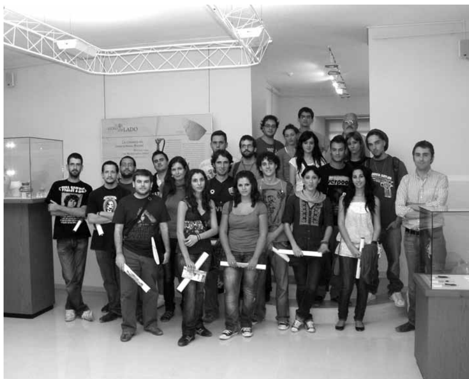
Lámina 8. Alumnos y profesores de la Universidad de Murcia en su visita a la exposición temporal “El otro lado. Asentamientos andalusíes en la frontera oriental nazarí”, mostrada en el Museo Arqueológico Municipal de Lorca.

Del 10 de septiembre de 2009 al 7 de enero de 2010 se mostró en la sala de exposiciones temporales del Museo la exposición “El otro lado. Asentamientos andalusíes en la frontera oriental nazarí” (Lám. 8), comisariada por Andrés Martínez Rodríguez, Juana Poce García y Jorge A. Eiroa Rodríguez. Esta exposición donde se mostraban cincuenta piezas arqueológicas de los fondos del Museo Arqueológico Municipal de Lorca y tres documentos del Archivo Municipal de Lorca tenía como objetivo principal presentar la frontera oriental con el reino de Granada a través de la investigación aportada por el estudio de varios yacimientos rurales andalusíes desde el momento de la conquista castellana en 1244 hasta la toma de Granada en 1492. La exposición organizada en cinco ámbitos expositivos estaba dotada de los contenidos apropiados para permitir dar a conocer el excepcional legado arqueológico exhumado fundamentalmente en el castillo de Tirieza (Lorca, Murcia) y otros yacimientos bajomedievales de Lorca (castillo de Puentes, castillo de Feli, Cortijo del Centeno, La Quintilla y Los Alagüeces).