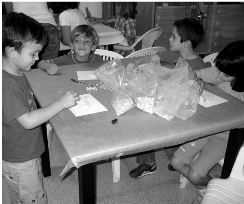
Lámina 9. Alumnos de educación infantil del C.E.I.P. Pasico Campillo, realizando un mosaico romano.

Cada taller didáctico tiene su material específico. El material para el taller de la pintura rupestre empleamos pegatinas de colores con diferentes motivos de las pinturas rupestres de Lorca, papel para pintar, tierra, huevo, brochas. Para el taller del mosaico romano es necesario teselas de diferentes colores de producción propia y unos cartones con diferentes motivos extraídos de los mosaicos de Lorca adaptados por edades (Lám. 9 y 10). Para los talleres de máscaras ibéricas y pasatiempos empleamos los materiales didácticos producidos por el Museo de El Cigarralejo de Mula adaptados al Museo Arqueológico Municipal de Lorca. Para el taller de la ciudad medieval, empleamos un audiovisual de producción propia, pegatinas y salida a realizar itinerario por la muralla medieval cercana al Museo, para los niños de educación infantil se emplean máscaras de temática medieval islámica y cristiana.