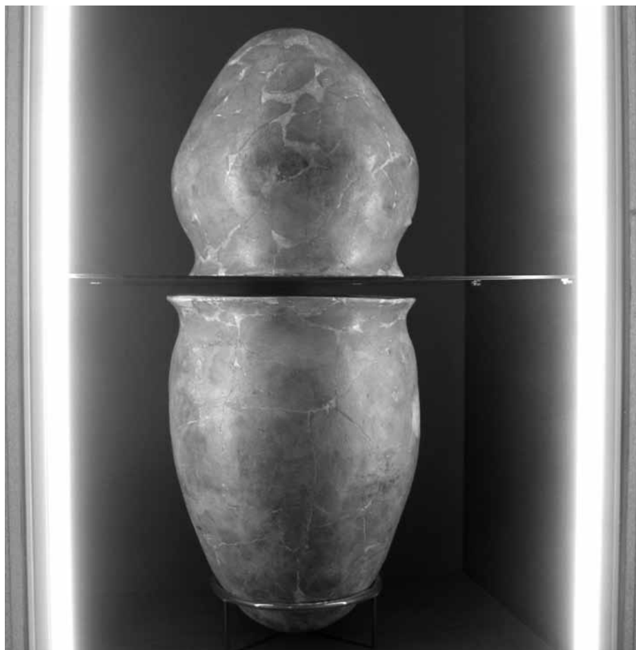
Lámina 4. Urnas del enterramiento 4 hallado en el subsuelo de la iglesia del convento de las Madres Mercedarias de Lorca en la exposición temporal “En los confines del Argar. Una cultura de la Edad del Bronce en Alicante”, celebrada en el Museo Arqueológico de Alicante.