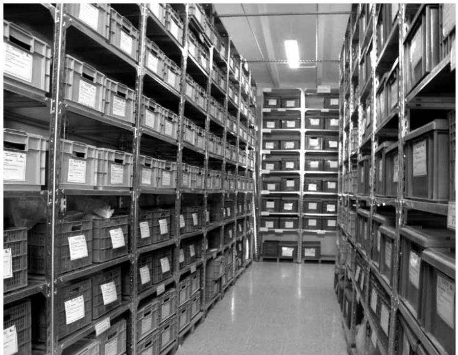
Lámina 12. Almacén externo 1 del Museo Arqueológico Municipal de Lorca.

La ordenación de los fondos que se encuentran en los almacenes visibles del Museo y en las dos naves externas (Lám.12) al edificio principal de Museo, así como el inventario de varias piezas de las nuevas colecciones que han ingresado para su incorporación en la exposición permanente o en las exposiciones temporales en las que se ha colaborado, ha ocupado una parte importante de la actividad del personal técnico del Museo.