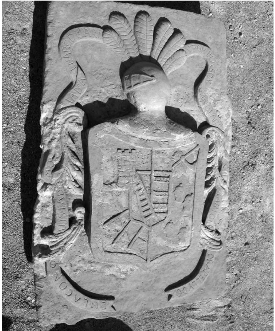
Lámina 5. Escudo de la familia Moya restaurado por los alumnos del Taller de Empleo Cronos.