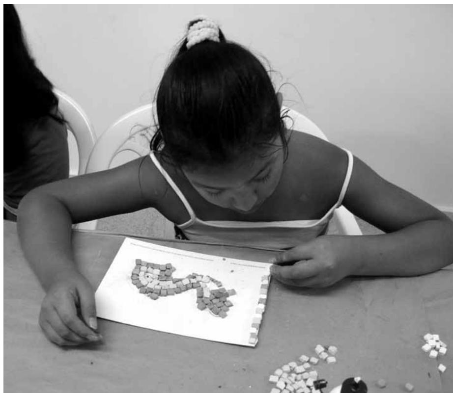
Lámina 10. Alumna de educación primaria del C.E.I.P. de San Cristóbal realizando un mosaico romano.

Durante el año 2009 el personal técnico del Museo ha realizado alguno de estos talleres, seleccionados por el profesor que organiza la visita, con 50 grupos de estudiantes del término municipal de Lorca. Excepcionalmente se realizó un taller sobre la pintura de los antiguos egipcios como complemento a la visita al Museo de los escolares de educación infantil del C.P. Virgen de las Huertas (Lorca) que habían desarrollado en el aula de su colegio el taller del faraón.