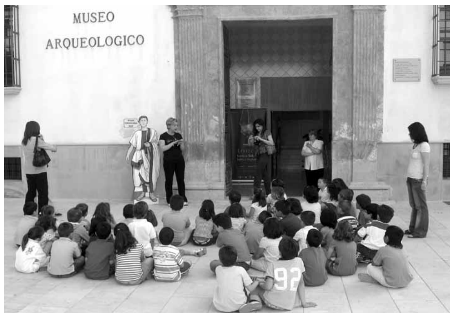
Lámina 6. Alumnos y profesores de educación infantil del C.E.I.P. Campillo de Lorca durante su visita al Museo Arqueológico Municipal de Lorca.