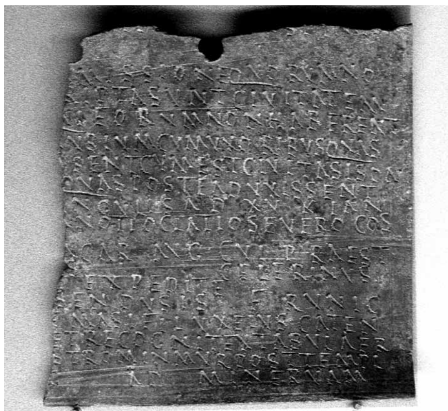
Lámina 5. Diploma militar romano de Kunzing. En la línea 8, el nombre del cónsul Ti(berius) Oclatius Severo se puede leer.