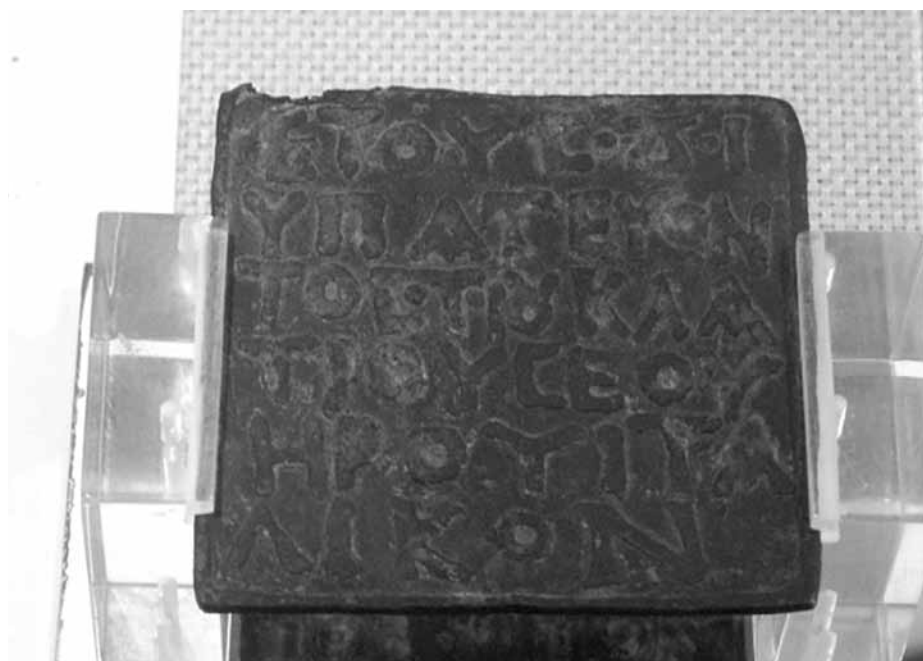
Lámina 7. Falsificación de Santisteban del Puerto, hoy en la Real Academia de Historia (inv. no. 1236/1). Cara B.