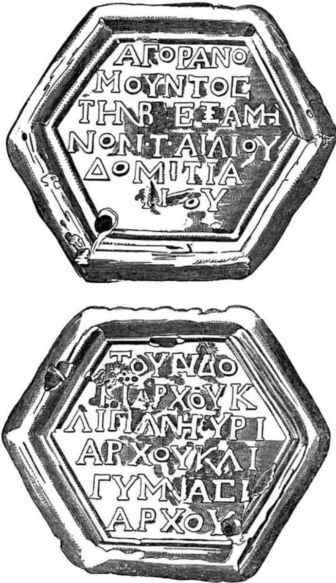
Figura 2. Dibujo de un ponderal encontrado en 1730 en el Lacio, concretamente en el Lago Albano (IG XIV 2417, 1). El plomo pesaba 384 gramos y llegó igualmente al Museo Kircheriano de Roma.