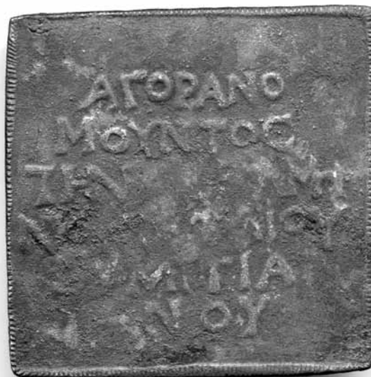
Lámina 3. Parte frontal (cara A) de la placa con el número de inventario 6074 en el Museo Arqueológico de Lorca.

La segunda pieza (Lám. 3 y 4) es una placa cuadrada con las medidas de 5,5 por 5,5 por 0,2 centímetros. El peso es de 45 gramos. El objeto posee un color predominantemente marrónáceo cobrizo, y en algunos puntos presenta abrasión y un color metálico y bronceo. Restos de coloración negra en ambas caras podrían ser una indicación de que también esta placa poseyó en algún momento un recubrimiento negro. La placa presenta igualmente inscripciones en ambas caras. En la cara A (Lám. 3), la parte central es ilegible. El campo epigráfico ocupa un espacio hexagonal en el centro de la placa. El tamaño de las letras varía ligeramente entre 0,6 y 0,7 centímetros, únicamente la Ómicron es más pequeña (0,4 centímetros). La Sigma se encuentra en una forma angular. En la cara A encontramos ligaduras en la línea 3 HN y MH, y en la cara B, en las líneas 1 AN, en la línea 3 NHT y en la línea 5 MN. También esta placa presenta un marco elevado pequeño, de hasta 2 milímetros de anchura, con una decoración tallada.