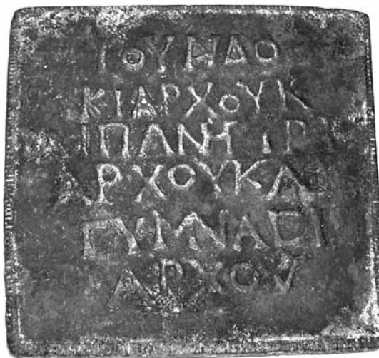
Lámina 9. Falsificación de Cardeñosa (Ávila), hoy en la Real Academia de Historia (inv. no. 1236/4). Cara B.

Finalmente, conviene preguntarse por qué las falsificaciones utilizan metal no ferroso en lugar de plomo. En principio, no sería problemática la fundición de las piezas en plomo en lugar de en metal no ferroso. Posiblemente la elección del metal no ferroso para estas piezas tenga como base la situación del mercado de antigüedades de finales del siglo XIX y de principios del siglo XX. La motivación en esta circunstancia presuntamente reside en el hecho de que los objetos en metal no ferroso son más fáciles de comercializar y alcanzan un precio notablemente más elevado que las poco vistosas piezas de plomo.