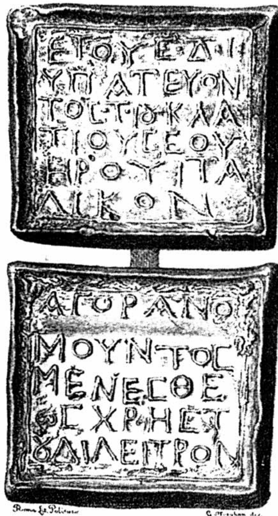
Figura 1. Dibujo de un ponderal encontrado antes de 1749 a unos 50 km al sur-suroeste de Roma, en la costa entre Anzio y el monte Circeo, y posteriormente mandado al Museo Kircheriano de Roma (IG XIV 2417, 2).

El texto es conocido gracias a la medida de plomo de aproximadamente 602,35 gramos de peso, encontrado antes de 1749 a unos 50 kilómetros al sur-suroeste de Roma, en la costa entre Anzio y el monte Circeo, y posteriormente mandado al Museo Kircheriano 3 de Roma (Inscriptiones Graecae IG XIV 2417, 2 = CIG IV 8544). Hoy la medida consta como desaparecida, pero tenemos un dibujo (Fig. 1).