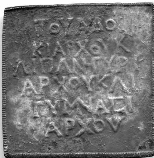
Lámina 4. Parte posterior (cara B) de la placa con el número de inventario 6074 en el Museo Arqueológico de Lorca.