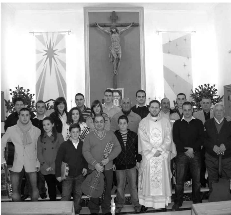
Lámina 5. Cuadrilla de Campillo (iglesia de la Santa Cruz, 24.12.2008).