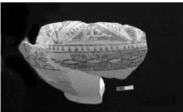
Lámina 1. Castillo de Lorca, nº inv: CL 23-1. Colec. Murviedo.

El siglo XII, marcado por el poder de los almorávides, es el más rico y lujoso para las producciones de cuerda seca, especialmente las de cuerda seca total: aparecen los bacines y las formas de tamaño grande. La qubba islámica de la calle Cava nº 11 de Lorca es el sitio que ha proporcionado el conjunto de piezas el más completo. No responde al azar si estas grandes y lujosas piezas se encuentran en un lugar de culto y asociadas a un uso ritual: sería una de las características de esta época, a pesar de que la cuerda seca total también sigue ornando ataifores lujosos que no tienen que ver con un uso religioso, pero sí con un uso simbólico ligado a la ostentación del poder. Este lujo en las producciones de cuerda seca total, poco conseguido en épocas anteriores, debe estar ligado, además de a un cambio en la salud financiera del país, a un cambio muy importante en la organización de la producción, en el nivel técnico de esta producción y en su asociación con una exportación marítima.