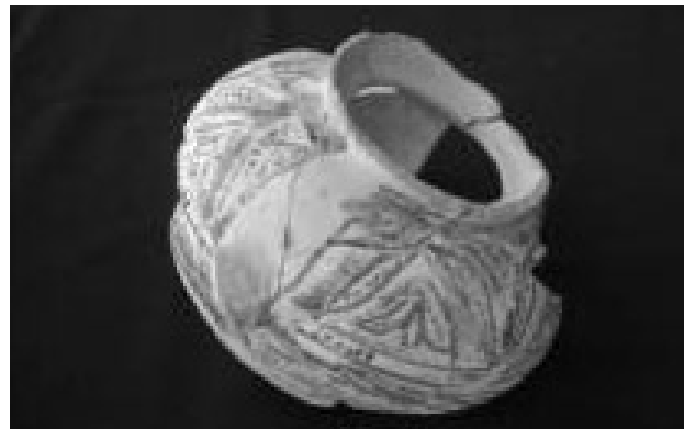
Lámina 2. Castellar de Alcoy, nº inv: C-4 5.196.