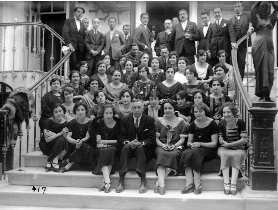
Lámina 10. Coral Santa Cecilia: misa de réquiem de Mozart por los soldados muertos en África (h. 1927).

septiembre, se dio un baile de sociedad que se prolongó hasta la madrugada. 284 De febrero a marzo de 1928, se celebraron los tradicionales bailes de Carnaval y Piñata; mientras que en junio, con motivo de la visita a Lorca del conde de Guadalhorce, ministro de Fomento, se decoraron las fachadas de varios establecimientos, entre ellos, el Casino. 285 Y, en diciembre, se participó en un aguinaldo para presos. 286