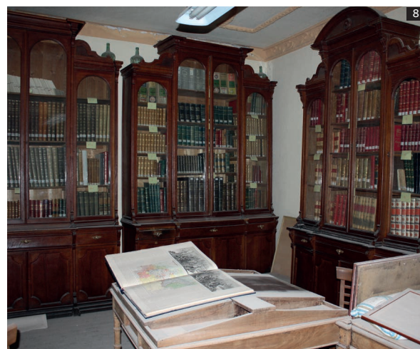
Láminas 7 y 8. Imágenes de la biblioteca.