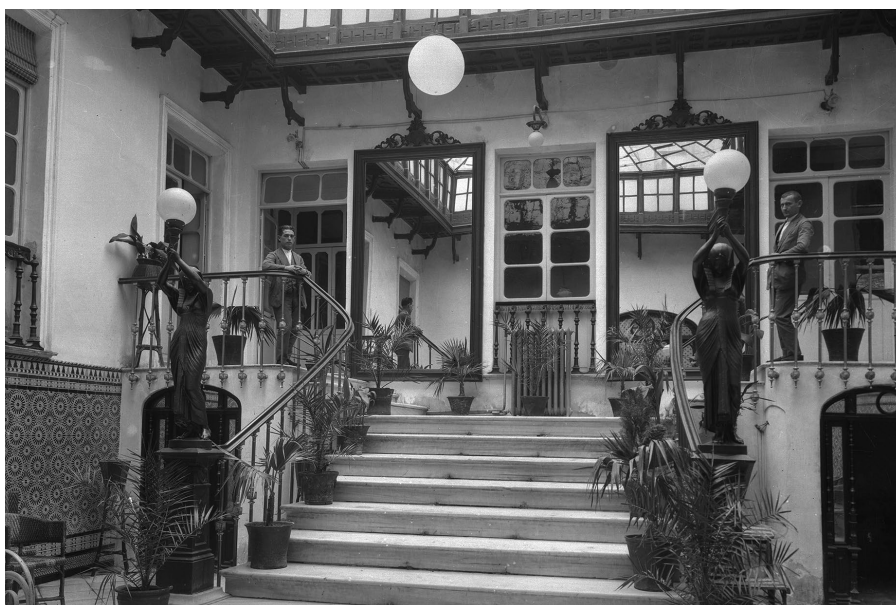
Lámina 3. Entrada del Casino (h. 1930).