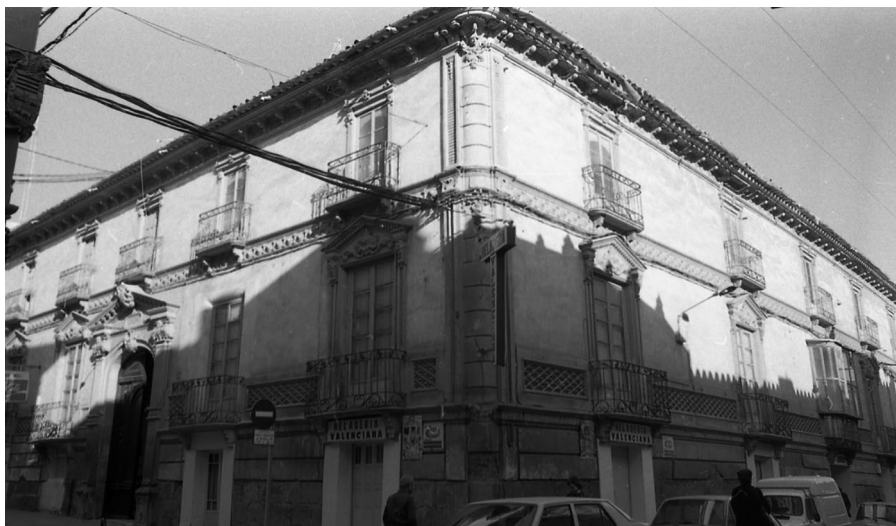
Lámina 1. Esquina del Casino (h. 1988).