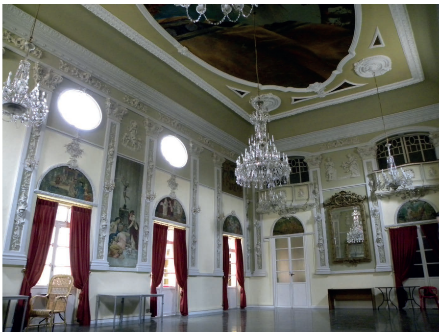
Lámina 5. El salón de baile (h. 2005).

donativo para el Asilo de niños abandonados de San José de Calasanz 172 y, el 17 de noviembre, por medio de una comisión de la Cámara de Comercio, se debatió y aprobó el darse de baja en el consumo eléctrico de la compañía Lorcamar. 173 En diciembre, se decidió la colocación de una mampara en la puerta del salón, denominado senado, para evitar las corrientes de aire frío, además se realizó un donativo al cuerpo de bomberos. 174