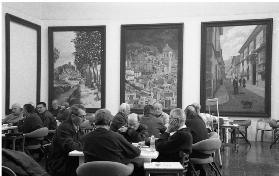
Lámina 11. Socios jugando al dominó (h. 1992).

miento de la UCD y el PCE. El nuevo ejecutivo tuvo que enfrentarse a una crisis económica, mientras implantaba las bases de la sociedad de bienestar, orientada hacia la socialdemocracia. Al finalizar el año, se vendieron en el Casino las entradas para otro concierto de Narciso Yepes en el Instituto número 2, con motivo del XI Festival de Música en la Navidad. 404