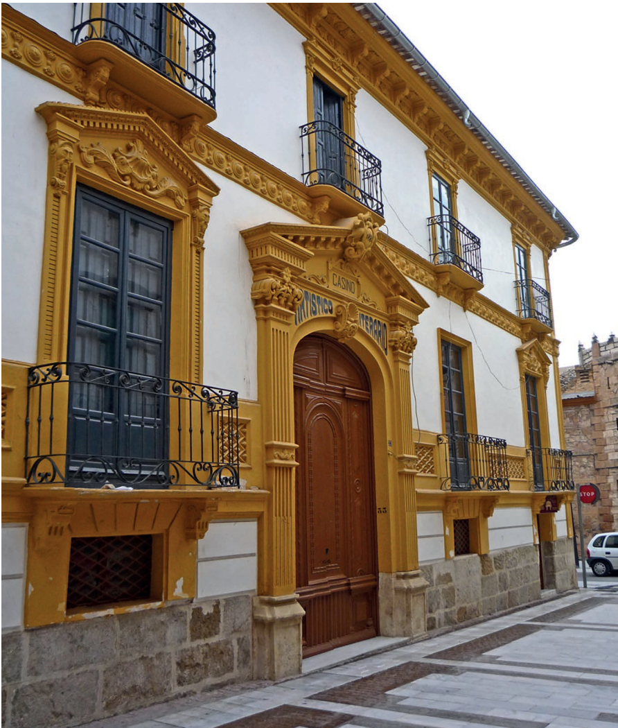
Lámina 2. Fachada del Casino (h. 2000).