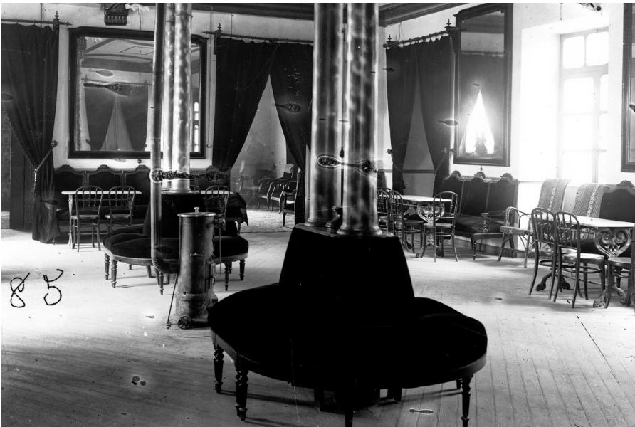
Lámina 4. Uno de sus salones (h. 1930).