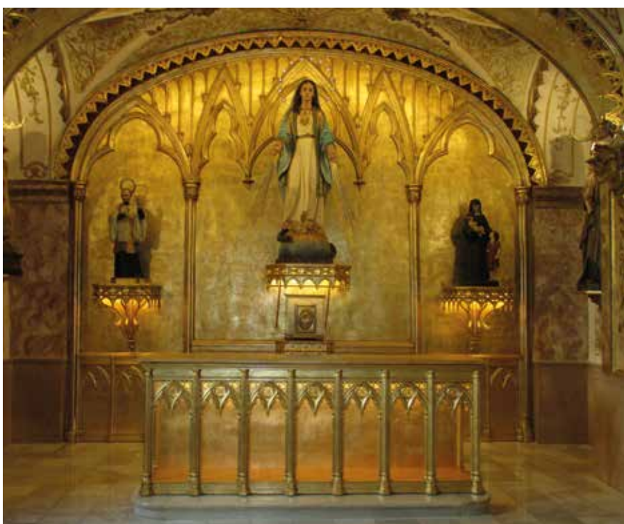
Lámina 12. Retablo y mesa de altar restaurados.

El retablo presentaba el dorado falso sentado al mixtión muy oxidado por lo que se justifica que, tras los trabajos de reposición de volúmenes perdidos mediante anastilosis con maderas similares a las originales, la reposición de moldurado y decoración incisa de la zona del antiguo altar, se procediera a la limpieza química de suciedad y grasas, estucado de lagunas, así como el sellado de toda la superficie con barniz de protección y la reposición total del dorado, mediante oro alemán recibido con mixtión graso. Para su protección se aplicó una capa de barniz de retoques, con protección ultravioleta y muy estable (Lám. 12).