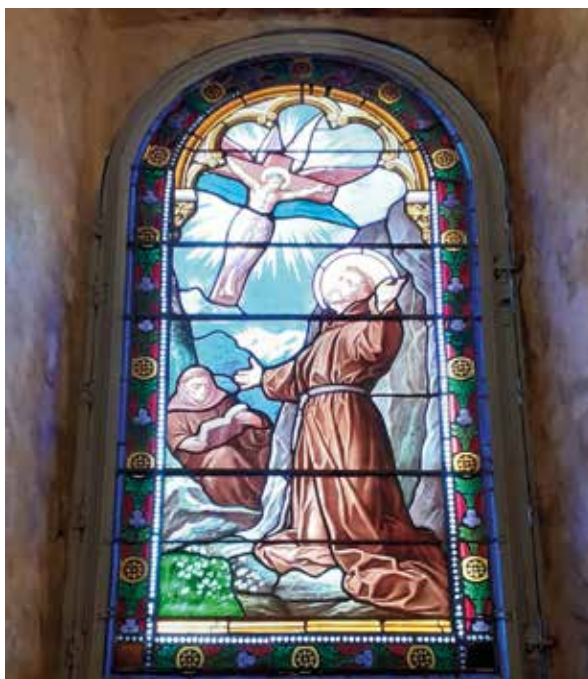
Lámina 13. Vidrieras restauradas.

Las vidrieras, por su estado de conservación, han precisado de un desmontaje ordenado de sus elementos, la limpieza de los vidrios, eliminación de masillas, la reposición de vidrios, sustitución de plomos y soldaduras en mal estado, acoplado de refuerzos metálicos, enmasillado y protección de elementos metálicos con barniz para metales (Lám. 13).