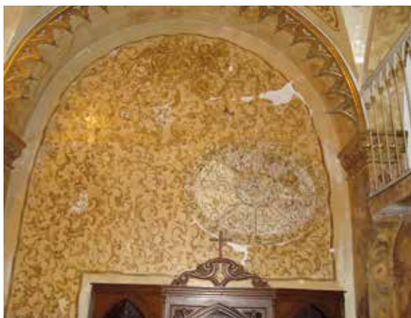
Lámina 3. Detalles del estado inicial de las pinturas parietales.