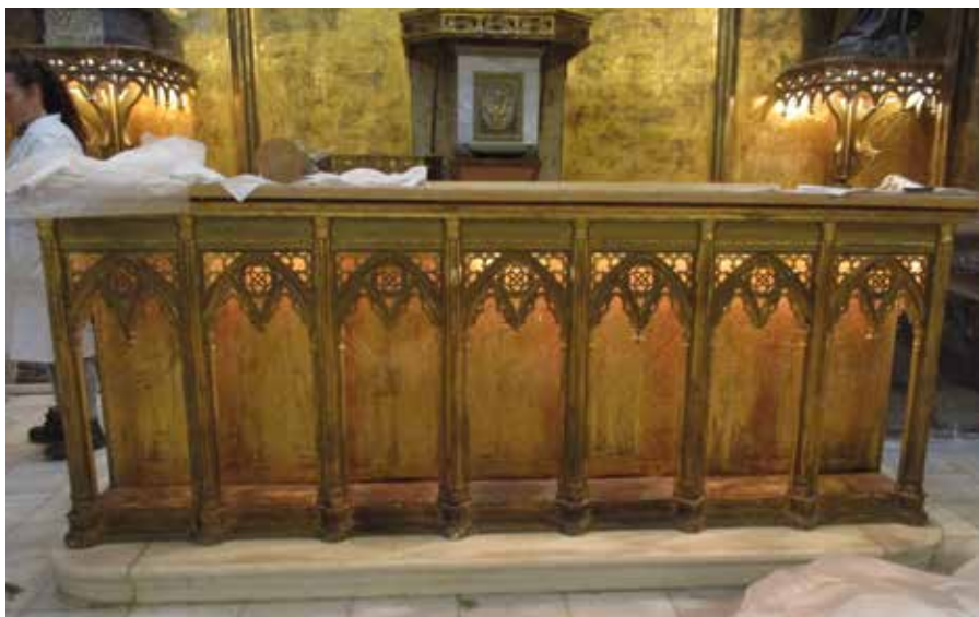
Lámina 6. Estado de la mesa de altar.

deficiencias estructurales. Resultaba muy debilitado en su estabilidad, con graves desajustes y pérdidas de elementos (Lám. 6).