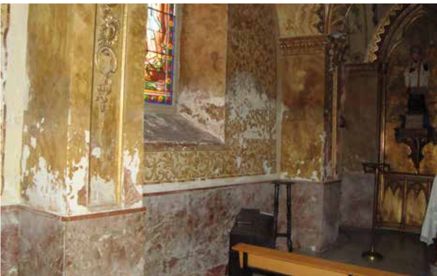
Lámina 2. Estado inicial de zócalos, suelos y pinturas parietales.

Los zócalos de rojo Alicante, recibidos con yesos a los muros, se encontraban muy afectados por inflorescencias salinas y disgregados por acción de la humedad de accesión capilar (Lám. 2).