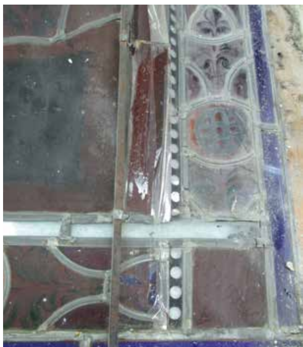
Lámina 7. Detalle del estado de las vidrieras.