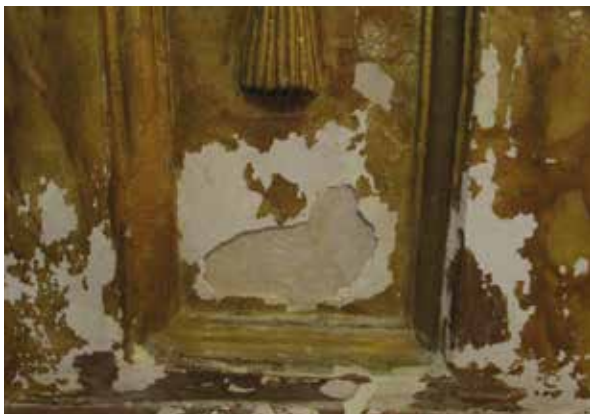
Lámina 4. Detalles del estado de las pilastras.

Con las mismas patologías que las pinturas parietales, las molduras de yeso de las partes bajas estaban desaparecidas y los dorados de las molduras conservadas muy oxidados (Lám. 4).