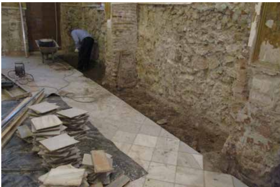
Lámina 10. Trabajos de eliminación del zócalo y construcción de atarjea.

Los suelos de mármol blanco de Macael se han tratado con coladas de fijación de morteros bastardos, reposición de losas en mal estado, sellado de juntas, desbastado, pulido y abrillantado de toda la superficie. En el muro exterior se ha ejecutado una atarjea ventilada de 40 por 50 centímetros en toda su longitud, con losas de mármol perforado, para reducir la afección de humedad por capilaridad en el muro (Lám. 10).