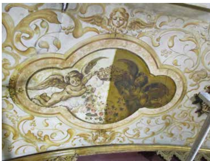
Lámina 11. Catas de limpieza.