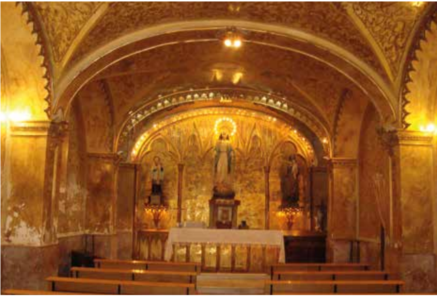
Lámina 1. Estado inicial de la capilla.