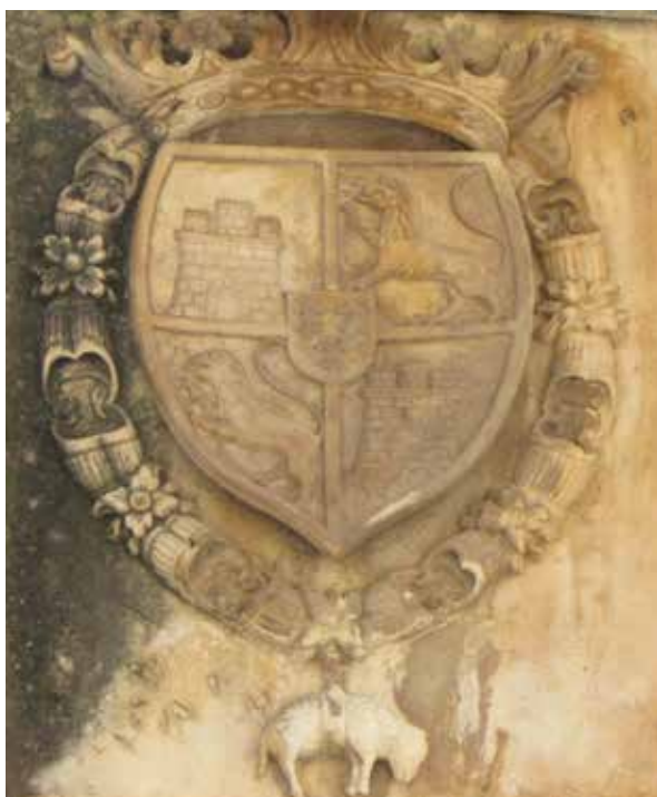
Lámina 7. Ficha 97.