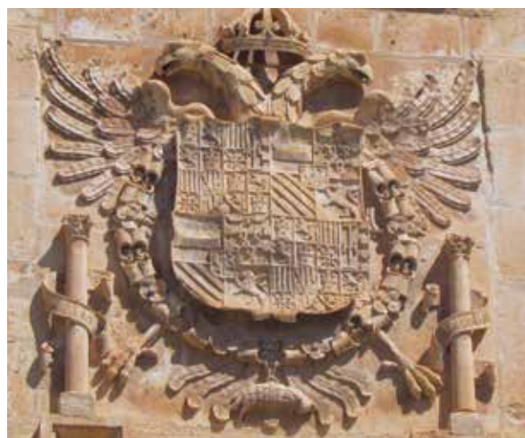
Lámina 2. Ficha 86.