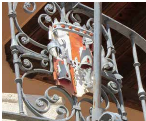
Lámina 10. Ficha 134.