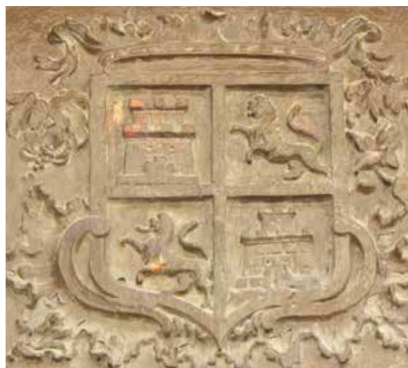
Lámina 6. Ficha 98.