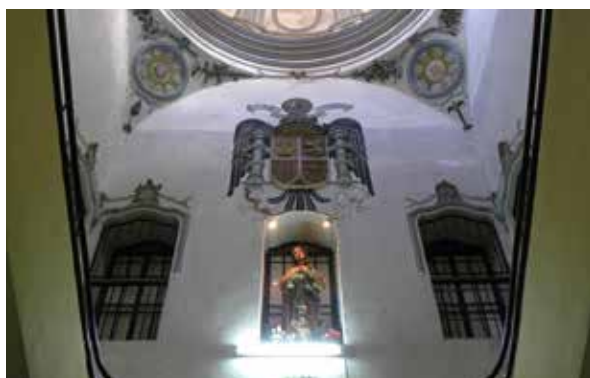
Lámina 24. Ficha 16