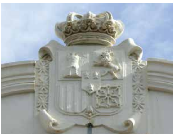
Lámina 20. Ficha 266.

Observaciones: Las armas nacionales de esta época en muchas ocasiones están siendo sustituidas o destruidas según el caso, lo que es un error a nuestro juicio ya que están colocadas en edificios y monumentos de la misma fecha de su construcción, y deberían ser respetadas por ser parte integrante de los mismos. En este caso se ha optado por taparlas por un vergonzoso tablero de madera.