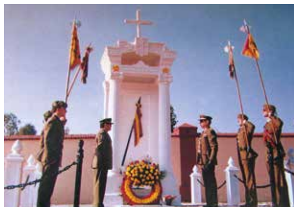
Lámina 23. Ficha 227.