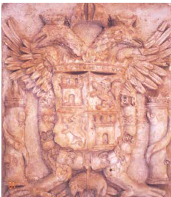
Lámina 1. Ficha 48.