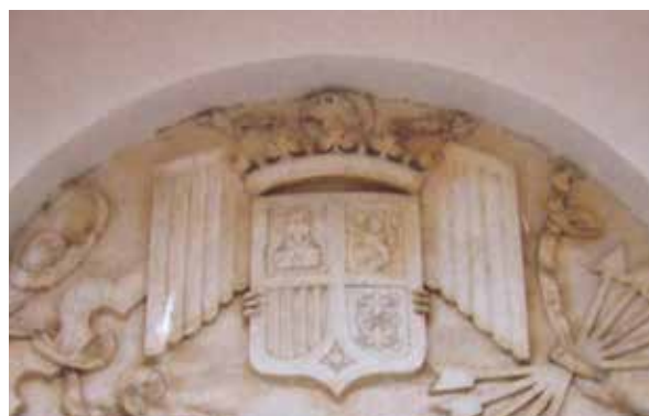
Lámina 25. Ficha 2.