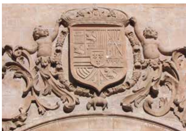
Lámina 13. Ficha 3.