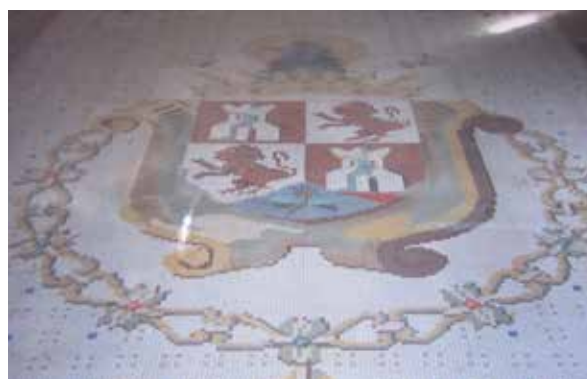
Lámina 21. Ficha 275.