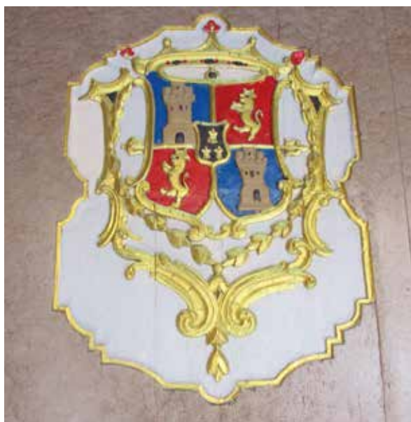
Lámina 12. Ficha 6.