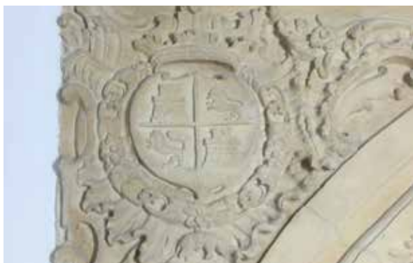
Lámina 9. Ficha 137.