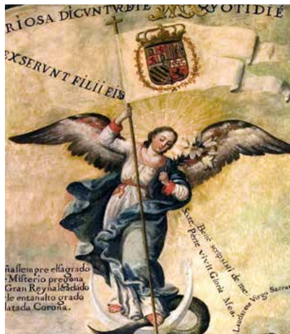
Lámina 16. Ficha 244.