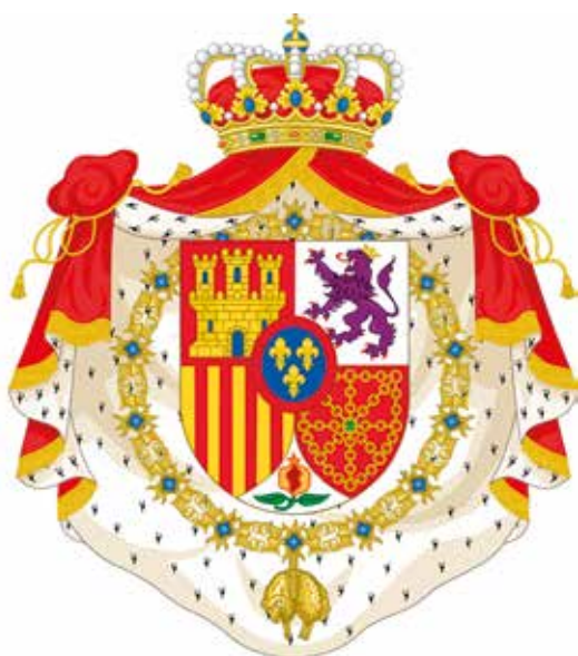
Lámina 27. Armas del rey de España.

En este caso las armas descritas están acoladas a un manto ducal, que es representado en escarlata forrado de armiños y en forma de tapiz sobre el cual aparece el escudo de armas.