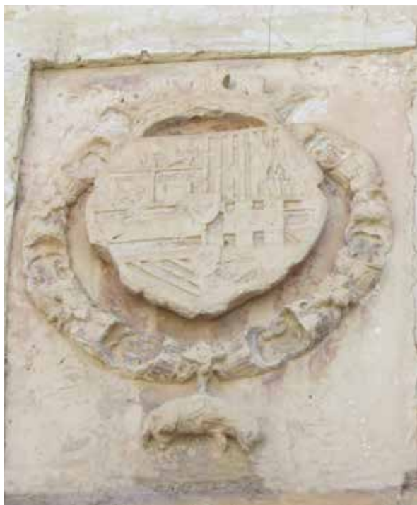
Lámina 17. Ficha 82.