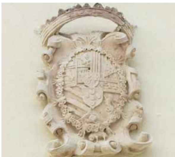
Lámina 5. Ficha 234.