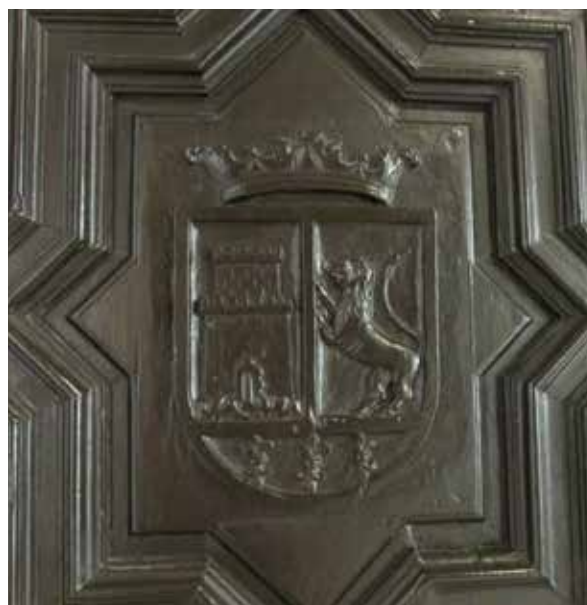
Lámina 8. Ficha 141.