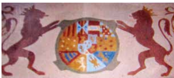
Lámina 22. Ficha 269.