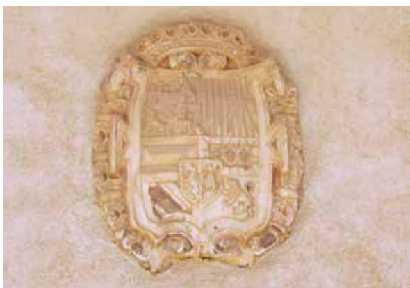
Lámina 3. Ficha 89.