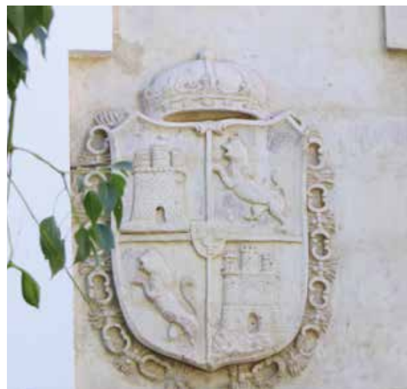
Lámina 19. Ficha 75.