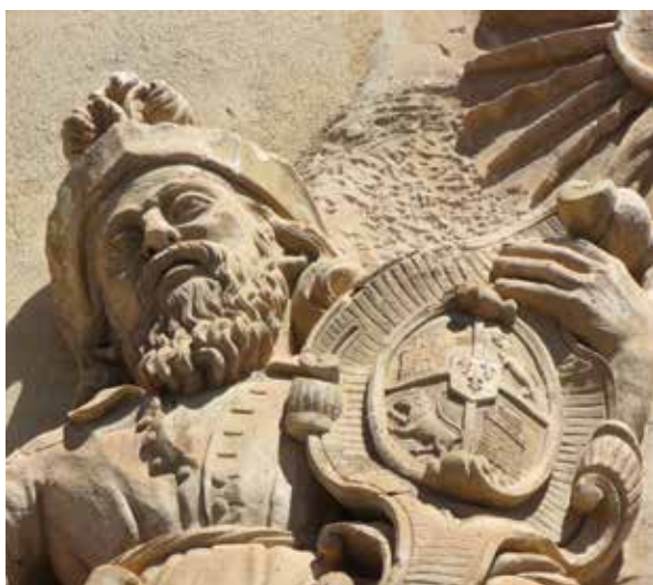
Lámina 15. Ficha 95.