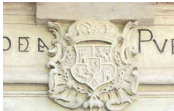
Lámina 18. Ficha 76.