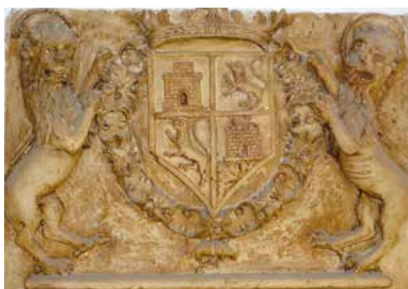
Lámina 14. Ficha 84.