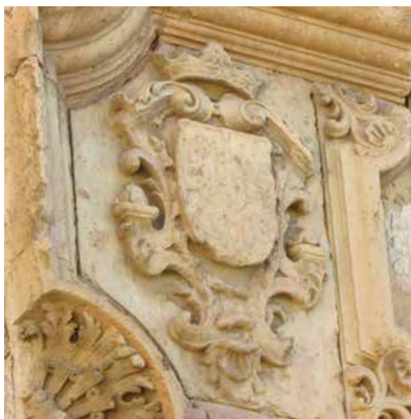
Lámina 11. Ficha 80.