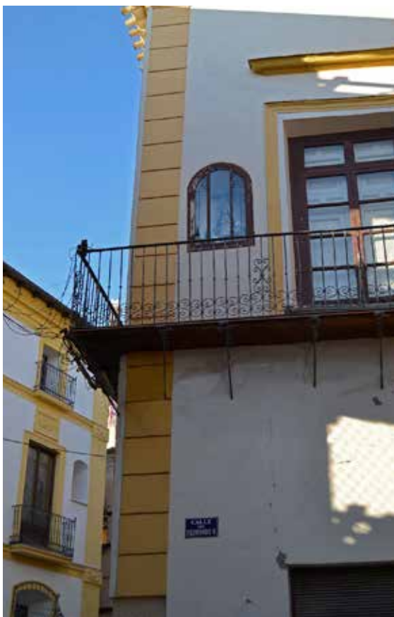
Lámina 1. Hornacina en el paramento exterior de una casa conteniendo una virgen.

Antes de continuar hay que tener presente la unión entre religión y creencias supersticiosas que en este caso se manifiesta en santos taumatúrgicos, los cuales siguen poblando calles en todo el país, ya sea insertos en hornacinas en las fachadas de casas particulares o como coronamiento de columnas y monumentos, en formato escultura e incluso pintura (Lám. 1). En este sentido cabe destacar para el presente artículo la importante presencia de estos en las puertas de las ciudades medievales, las cuales solían conocerse con el nombre del santo bajo cuya protección se encontraba. Lo mismo ocurre con otro tipo de construcciones aunque su poder protector residía no tanto en el santo como en su ubicación al formar parte de “cinturones religiosos”; esto es la construcción planificada de dichos edificios –iglesias, conventos, ermitas– en lugares estratégicamente distribuidos por la localidad 1 .