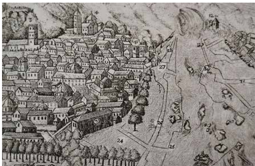
Figura 1. Detalle del grabado que ilustra la riada de 1802, daños y situaciones causadas por la misma. Con n.º 27 se aprecia la ubicación que ocupaban la plaza y la puerta de San Ginés.

Según las fuentes orales, la escultura que nos ocupa sería la destinada a ocupar una hornacina en la puerta de San Ginés de Lorca, final del camino de Murcia y Caravaca de la Cruz, y que fue reformada en múltiples ocasiones hasta su demolición en 1892 por su estado ruinoso 3 , según consta en las Actas Capitulares de la localidad. Dicha puerta hubo de resistir varias riadas importantes, entre ellas la consecuente de la rotura del pantano de Puentes de 1802 que arrasó todo a su paso y que en la ciudad arruinaría gran parte de los barrios de San Cristóbal 4 , Santa Quiteria, plaza de San Ginés y calles colindantes (Fig. 1). Sería precisamente en esta ocasión cuando, según dichas fuentes, el agua arrastrara consigo la imagen del santo, siendo encontrado en la vecina localidad de Totana. Una vez devuelta sería depositada en la casa de los Albuquerque, actual Archivo Histórico Municipal, junto con otros materiales y objetos artísticos. Es en este momento cuando Juan Guirao García, cronista de Lorca y archivero municipal entre 1976 y 2011, dice recordar una fotografía en la que aparece la escultura embarrada en la falsa del Ayuntamiento. En