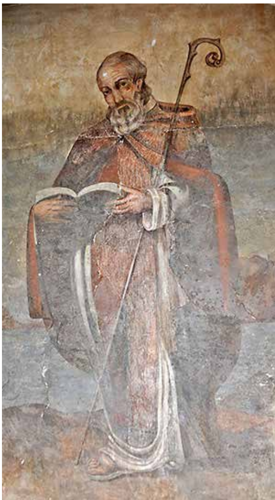
Lámina 5. Detalle de San Ginés de la Jara según la pintura del Porche de San Antonio en la que se aprecia la reintegración realizada en la última intervención.