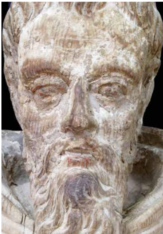
Lámina 7. Detalle de la cabeza con los repintes en rojo en ojos y labios.