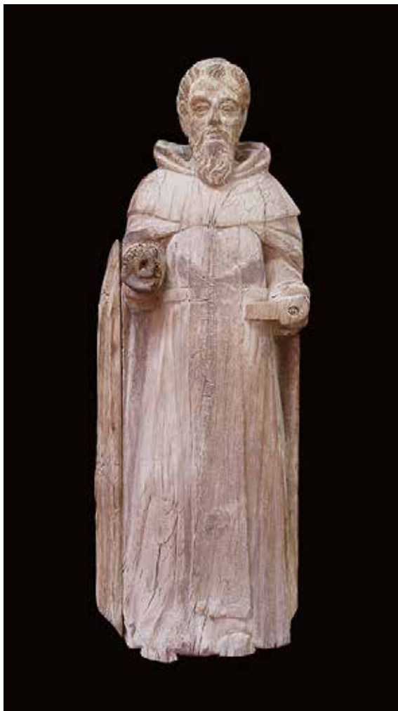
Lámina 6. Escultura depositada en el MUAL que podría representar a San Ginés de la Jara a la que se le ha colocado el listón conservado de uno de los bordes de su manto para realizar la fotografía.

La escultura, de bulto redondo, es por el momento de autor desconocido y representa a un hombre de cierta edad en pie, vestido con hábito, con la cabeza ligeramente ladeada e inclinada y que ha perdido pies, manos, atributos, pedestal y parte del hábito (Lám. 6). De gran hieratismo y frontalidad, su desproporción y disposición evidenciarían que fue realizada para situarse por encima del punto de vista del espectador, idea que concordaría con Morote cuando dice acerca de la puertas que “ la de San Ginés (...) tiene en su lintel una primorosa Imagen antiquísima de escultura de San Ginés de la Jara ” 45 . De este modo, y pese a ser de bulto redondo, la espalda y demás zonas difíciles de apreciar desde un punto de vista bajo, están trabajadas aunque bastante menos que el frente. Ello, junto con la desproporción y posición de la cabeza, ligeramente ladeada y mirada baja, denotaría haber sido concebida para ser colocada en un lugar con cierta altura pero que permitía que se vieran otras partes. Conserva además un enganche metálico en la espalda que podría haberse usado para izarla o bajarla de dicho lugar para, por ejemplo, presidir procesiones en su honor y/o rogativas 46 además de presidir la entrada a la ciudad por esta puerta.