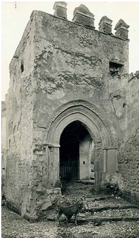
Lámina 2. Fotografía del Porche de San Antonio antes de la intervención de principios del siglo XX en cuyo interior se aprecia una verja que podría haber contenido un altar, la cual protege el lugar donde apareciera la pintura de San Ginés.

Como es sabido, Espín revisó todo tipo de documentación relativa a Lorca dado que tenía acceso a su archivo. Así, pudo examinar un listado de las puertas que tenía la ciudad en el siglo XVI, pudiendo decir que “la torre de Cervera estaba en San Pedro; y el Porche de San Antonio se llamó antes torre del licenciado Piñero (1530), y antes torre y puerta de San Ginés (1500); y otra puerta que se hizo más abajo demolida hacia 1890 también de San Ginés” 13 . De este modo, puede interpretarse que la puerta de San Ginés más moderna estaba realizada ya en 1526 14 , siendo posterior a la de San Antonio, realizada en época islámica y reformada en el siglo XIII.