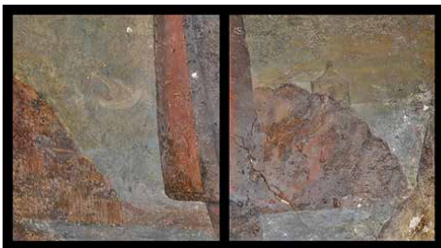
Lámina 3. Detalles de la pintura mural conservada en el Porche de San Antonio de una embarcación y una ermita tras San Ginés. El primero hace referencia a una de las versiones de cómo arribaría el santo a las costas murcianas. El segundo se corresponde con la ermita que erigió con ayuda de los ángeles en el monte Miral, más que el monasterio por la sencillez de su arquitectura.

des como Lorca u Orihuela, de las que se conserva documentación 30 , o siendo patrón de localidades como Cartagena. Otra cosa que llama la atención es el modo coincidente en que algunas de ellas adoptaron al santo como su patrón y que, según la tradición, su nombre saldría elegido en un papel en un sorteo y, ante el descontento general por ser poco conocido, volvería a sortearse resultando nuevamente elegido. Por otra parte tampoco se sabe a ciencia cierta aquello de lo que protege ya que sus milagros son diversos, siendo lo más conocido la protección de marineros 31 (Lám. 3), de la vid y labores del campo 32 . A ello hay que unir el ser patrón de los notarios y escribanos forenses, en el caso específico de San Ginés de Arlés 33 . Este desconcierto es lógico por la propia confusión existente en relación a la figura del santo en sí. Lo que está claro es la presencia en la zona de este santo y su importancia, tal que forma parte de la iconografía del imafrente de la catedral de Murcia, siendo el nombre de Ginés uno de los más comunes y manteniéndose su culto de forma bastante discreta excepto en lugares puntuales.