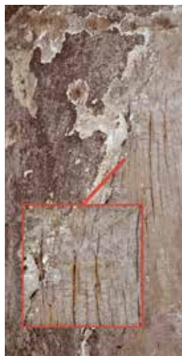
Lámina 8. Detalle de la escultura con lo que podrían ser iniciales y otros elementos.

cierta la creencia de que es la escultura de San Ginés y que fue arrastrada por una riada hasta Totana, el deterioro policromo 49 podría ser debido al arrastre, lo que resultaría verosímil al apreciarse a simple vista rozaduras, principalmente en zonas sobresalientes como la nariz o haber perdido las manos, los pies y los atributos. Además existen en la espalda otras “heridas” hechas aparentemente de manera intencionada. Así, mayormente no conservan ni las capas de preparación excepto las situadas en aquellos lugares menos expuestos –espalda, cuello y oquedades del rostro, cabello y barba–. Peor suerte han corrido los ojos, labios y algunos lugares de la nariz al haber sido repintados en rojo (Lám. 7). También ha de reseñarse la aparición de lo que parecen ser iniciales realizadas directamente sobre la madera aunque existe una gran dificultad para observarlas ya que son milimétricas (Lám. 8), por lo que se hace necesario un estudio que implique el análisis de las mismas y la búsqueda de otras posibles bajo la policromía y otras zonas. Por contra, se pueden apreciar aún a simple vista, aunque dificultosamente, lo que podría ser bol rojo, bajo la policromía en zonas concretas, lo que daría mayor consistencia a la teoría de ser realmente el San Ginés de que hablan los documentos al ser base para el dorado (Lám. 4).