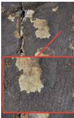
Lámina 4. Detalle de la espalda de la escultura en la que se pueden ver las capas de policromía y preparación de la escultura entre las que se encuentran las citadas fibras y el bol.