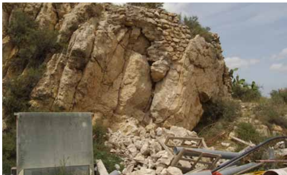
Lámina 26. Desprendimiento de la base de la cara sureste de la torre de Guillén Pérez de Pina.

Los restos de la antigua torre identificada con la torre de Guillén Pérez de Pina mencionada en la documentación bajomedieval castellana y aragonesa también se vieron afectados, pues su frente sureste tuvo pérdidas de la base (Lám. 26). Los trabajos, en esta ocasión, consistieron en recuperar sus mampuestos y en proporcionar una nueva base de apoyo.