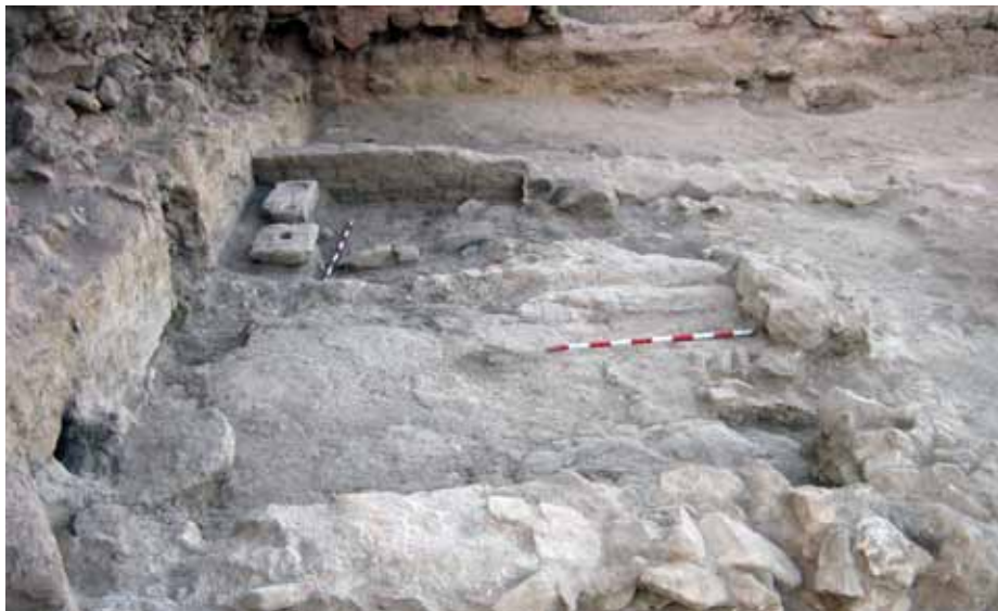
Lámina 3. Taller de vidrio bajomedieval del sector A.1.2.

Simultáneamente se fueron desarrollado algunas intervenciones concretas en sectores que se englobaban dentro del espacio que iba a ser ocupado por el parador nacional de turismo y que finalmente fueron incorporadas al futuro parque arqueológico. Por una parte se realizaron dos sondeos arqueológicos en la ermita de San Clemente, que permitieron confirmar las cuatro fases constructivas que podían identificarse a partir del análisis de la documentación escrita. Por otra parte, se intervino en el espacio situado bajo el abrigo rocoso que en un primer momento fue erróneamente interpretado como unos baños públicos bajomedievales. Aunque los estudios arqueológicos no descartaron su uso, en un momento islámico inicial, como espacio de almacenamiento hidráulico, la excavación permitió documentar, por encima de los restos arqueológicos identificados con el proceso de conquista un espacio dedicado a la estabulación de ganado durante la Baja Edad Media (Lám. 4).