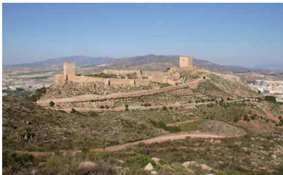
Lámina 1. Vista general del castillo de Lorca.

El castillo de Lorca constituye un yacimiento arqueológico de excepcional interés para conocer el pasado prehistórico, clásico y, muy especialmente, medieval del Sureste peninsular (Lám. 1). Aunque su importancia se conoce desde los trabajos del padre Morote (1741) o Cánovas Cobeño (1890), solo en los últimos años ha sido objeto de investigaciones arqueológicas, en especial entre 1999 y 2002, como consecuencia de la creación del espacio de ocio denominado Lorca, Taller del Tiempo , y, sobre todo, entre 2002 y 2010, en los terrenos en los que se estaba construyendo el parador nacional de turismo. En la actualidad, ambos proyectos se han concluido y los resultados, más allá de la polémica, son sobradamente conocidos. Los espectaculares hallazgos arqueológicos, en especial la alcazaba andalusí y la judería bajomedieval y su sinagoga 2 , reafirmaron la importancia del castillo y pusieron encima de la mesa los problemas derivados no solo de la intervención en un “monumento vivo”, sino, principalmente, de una sucesión de actuaciones arqueológicas descoordinadas y no planificadas que no se correspondía con las necesidades ni con la relevancia del yacimiento arqueológico.