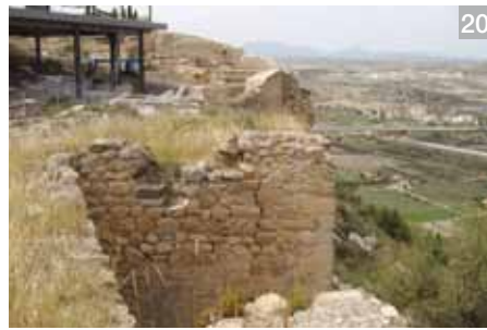
Lámina 20 y 21. Detalle de los daños de la muralla del castillo en el entorno de la puerta del Pescado.