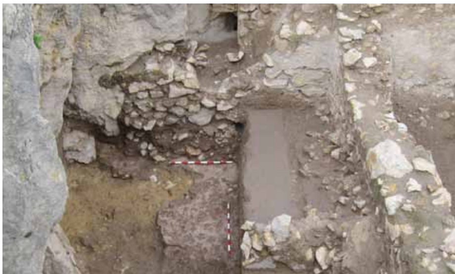
Lámina 4. Espacio de estabulación bajomedieval documentado bajo el abrigo rocoso del sector A.1.1.

Simultáneamente se fueron desarrollado algunas intervenciones concretas en sectores que se englobaban dentro del espacio que iba a ser ocupado por el parador nacional de turismo y que finalmente fueron incorporadas al futuro parque arqueológico. Por una parte se realizaron dos sondeos arqueológicos en la ermita de San Clemente, que permitieron confirmar las cuatro fases constructivas que podían identificarse a partir del análisis de la documentación escrita. Por otra parte, se intervino en el espacio situado bajo el abrigo rocoso que en un primer momento fue erróneamente interpretado como unos baños públicos bajomedievales. Aunque los estudios arqueológicos no descartaron su uso, en un momento islámico inicial, como espacio de almacenamiento hidráulico, la excavación permitió documentar, por encima de los restos arqueológicos identificados con el proceso de conquista un espacio dedicado a la estabulación de ganado durante la Baja Edad Media (Lám. 4).