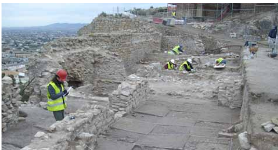
Lámina 5. Excavaciones arqueológicas de 2011 en el sector A.2.1, junto a la puerta del Pescado.

Durante el desarrollo de todas estas actuaciones arqueológicas tuvo lugar, de forma paralela, toda una labor de consolidación y puesta en valor del yacimiento (Lám. 6), canalizada mediante varios proyectos de corta duración que abordaron cada uno de los sectores una vez que los trabajos de investigación arqueológica hubieron concluido 7 . Igualmente, se desarrolló un plan específico de difusión, con el objetivo de superar los círculos académicos mediante una serie de encuentros públicos de difusión (conferencias y charlas impartidas por los responsables del proyecto), a través del uso de los recursos de Internet ( Twitter , Facebook y una página web propia, www.castillodelorca.com ) o, muy especialmente, mediante el plan de visitas denominado “Abierto por excavación” 8 .