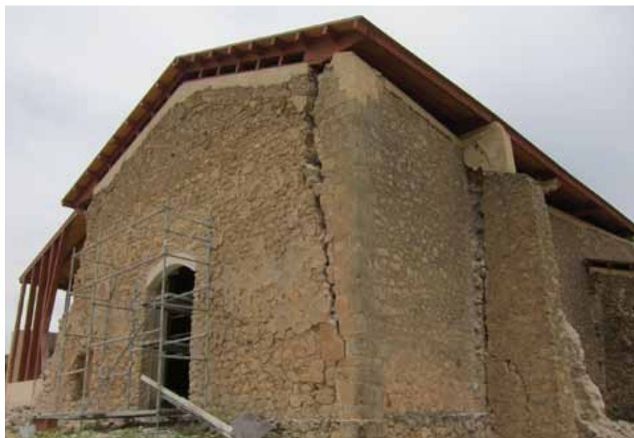
Lámina 27. La ermita de San Clemente, horas después de los terremotos.

Finalmente, la ermita de San Clemente puede considerarse un ejemplo paradigmático de lo sucedido en el parque arqueológico del castillo. Gracias a la nueva cubierta que se había instalado, el impacto del terremoto sobre ella fue menor y no provocó el derrumbe total del edificio. Aun así, la acción de los seísmos fue muy fuerte sobre el inmueble, pues el frente noreste y el frente noroeste, las partes estructurales más afectadas, sufrieron la aparición de abundantes grietas y el desplome de elementos estructurales (Lám. 27). Los trabajos de recuperación estuvieron encaminados a consolidar las estructuras afectadas y recuperar el contrafuerte exterior del lienzo noreste del edificio.