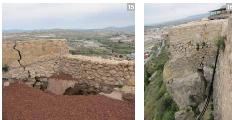
Lámina 15 y 16. Daños sobre los restos de muralla en el extremo oeste de la cortina 15.

Uno de los puntos más dañados fue la esquina de la muralla en la que se sitúa en el punto de acceso al parque arqueológico desde el recinto de Lorca, Taller del Tiempo . Allí, los desprendimientos, facturas y pérdidas en el tercio inferior de la muralla motivaron la aparición de una gran oquedad y el arrastre y hundimiento de parte del material de relleno (Lám. 15 y 16). Los trabajos de consolidación implicaron el desmontaje y la recuperación de nuevo del lienzo de muralla, así como el colmatado y sellado de la gran perforación.