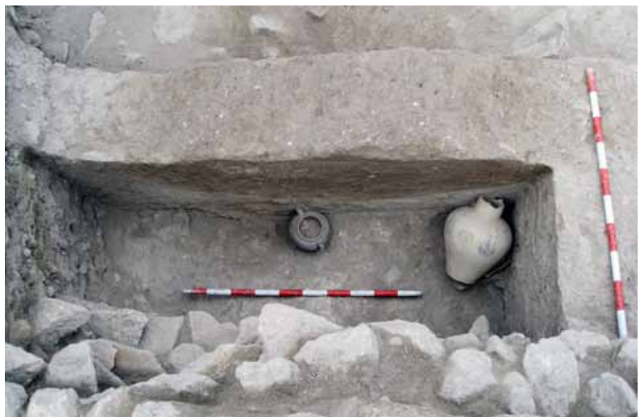
Lámina 2. Restos almohades en el sector A.1.2.

Posteriormente, en el sector A.1.2, la excavación permitió definir una nueva vivienda bajomedieval, la unidad doméstica XV y, lo que es más importante, se pudo documentar la ocupación andalusí, cuyos restos habían sido arrasados en el primer sector (Lám. 2). Además, se identificó un área artesanal en el extremo norte del barrio de la judería, en la que destacan una serie de estructuras que se identificaron con un taller de producción de vidrio de los siglos XIV y XV, con dos pequeños hornos y una zona de martilleo mecanizado de masa vítrea (Lám. 3).