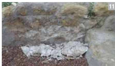
Lámina 11, 12, 13 y 14. Fisuras y pérdida de revocos como consecuencia del terremoto en los restos arqueológicos de la judería medieval del castillo de Lorca.

En este sector, como consecuencia del terremoto los restos arqueológicos se vieron afectados principalmente por fisuras, junto a pequeñas pérdidas de mampuestos y revocos. Se puede asegurar que, de manera general, las áreas excavadas y consolidadas entre los años 2009 y 2011, no se vieron gravemente afectadas. Las zonas más dañadas por los terremotos correspondieron a los sectores A.1.1 y A.2.2, donde aparecieron dos grandes socavones en estancias cercanas a los lienzos de muralla. En la mayoría de los casos no implicaron graves daños sobre los restos arqueológicos, ya que no perjudicaron su integridad estructural (Lám. 11-14). En resumen, se constató la presencia de diversas fisuras y pérdidas de mampuestos en las fábricas de las diferentes estructuras murarias que se habían documentado durante el proceso de excavación arqueológica. Estas patologías fueron consolidadas durante el proceso de ejecución del proyecto de restauración en el área: puesto que el día del terremoto se interrumpieron los trabajos de restauración, su reanudación implicó la actuación sobre estos desperfectos de manera complementaria. La situación solo exigió una mínima intervención, si bien dos puntos estructuralmente muy dañados fueron destacados por su gravedad, pues era posible su desplome; lo que supondría una situación de peligro excepcional tanto al acceso al castillo por el camino septentrional del cerro como a las casas construidas bajo la ladera.