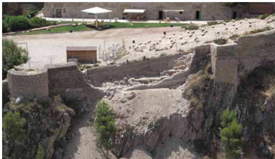
Lámina 10. Vista aérea de la cortina 9.

Junto con las actuaciones arqueológicas en la torre del Espolón se realizaron excavaciones en la zona de la cortina 9 de la muralla del castillo, donde se pudo documentar un tramo de la muralla almohade preexistente sobre la que se construyó el lienzo de muralla bajomedieval que se derrumbó durante los seísmos (Lám. 10).