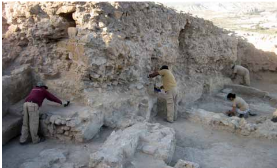
Lámina 6. Trabajos de consolidación en el área artesanal del futuro parque arqueológico.

Este era, en líneas generales, el desarrollo del proyecto del parque arqueológico del castillo de Lorca justo en el momento en que todo se vio repentinamente modificado por el terremoto del 11 de mayo de 2011, que obligó a reconducir todo el proyecto hacia un objetivo muy distinto.