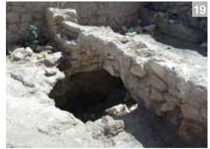
Lámina 17, 18 y 19. Efectos del terremoto en el área situada junto a la muralla, en el sector A2-1.